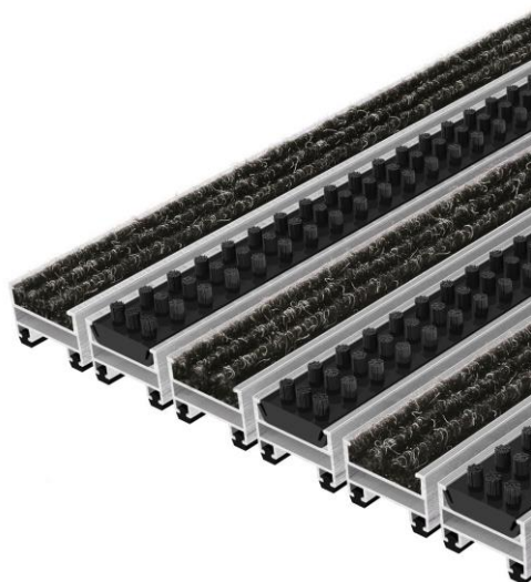
Foto zeigt Matte mit einer Höhe von 22 mm