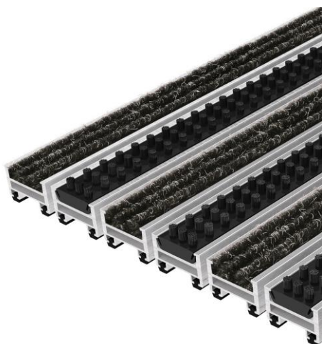
Foto zeigt Matte mit einer Höhe von 22 mm