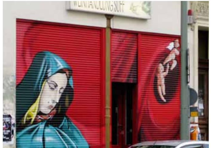
Weinhandlung Suff, Berlin

Mit Cargoroll MAXISAFE 77 ist auch nach Ladenschluss der Kreativität keine Grenze gesetzt. Shopfront als Künstlerische Projektionsfläche.