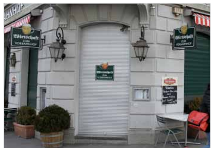
Restaurant Vorbahnhof, Zürich

Mit ECOMONT 16+ Safe können Sie sicher sein, dass auch nach Feierabend nicht noch eine zusätzliche Runde eingeläutet wird. Die kompakte und stabile Optik verhindert, dass ein paar allzufröhliche Nachtschwärmer auf dumme Gedanken kommen.