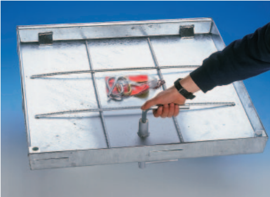
Typ BV-GDZ Öffnen von der Unterseite über Zentralverriegelung