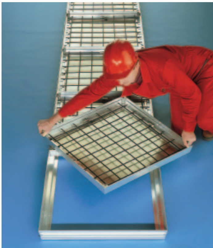
Typ BVA-RA vor der Montage

Anwendungsempfehlung: Ideale Abdeckung für Versorgungs- und Entsorgungskanäle im Industrie- und Werkstättenbereich, z. B. für die Energie-, Wasser- und Druckluftversorgung.